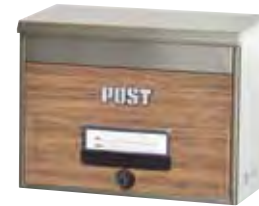
CSP-8700L DW カラー/濃木目(シート貼り) 材質・仕上げ/ステンレスSUS304、焼付塗装 側面窓材質/樹脂成型品 投入口サイズ/394×52 JAN/4963784 668704