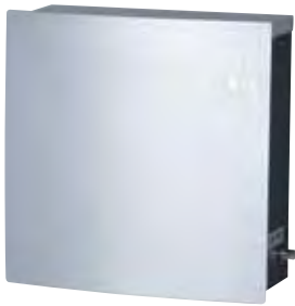
MB-1SV カラー/シルバー(投入口・扉) 本体サテンブラック 投入口サイズ/376×55 JAN/4963784 691016