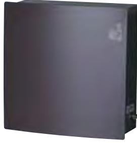
MB-1BR カラー/ブラウン(投入口・扉) 本体サテンブラック 投入口サイズ/376×55 JAN/4963784 691030