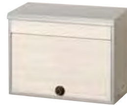
SMP-70L WD カラー/木目(シート貼り) 材質・仕上げ/亜鉛めっき鋼板、焼付塗装 側面窓材質/樹脂成型品 投入口サイズ/394×52 JAN/4963784 667028