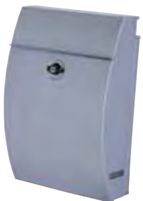
MT-2SV カラー/シルバー 材質・仕上げ/亜鉛めっき鋼板、焼付塗装 側面窓材質/樹脂成型品 サイズ/325×150×480 投入口サイズ/270×40 箱入数/4 JAN/4963784 691115