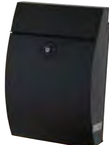
MT-2BK カラー/サテンブラック 材質・仕上げ/亜鉛めっき鋼板、焼付塗装 側面窓材質/樹脂成型品 サイズ/325×150×480 投入口サイズ/270×40 箱入数/4 JAN/4963784 691122