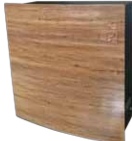
MB-1DW カラー/濃木目(扉 シート貼り) 本体・投入口サテンブラック 投入口サイズ/376×55 JAN/4963784 691047